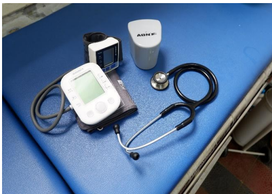
Alat Tensi dan stetoskop