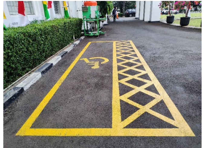
Parkir Mobil Khusus Difabel